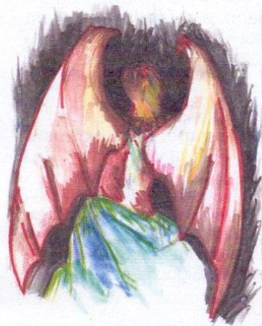
ILLUSTRAZIONE DI JEROME YPULONG